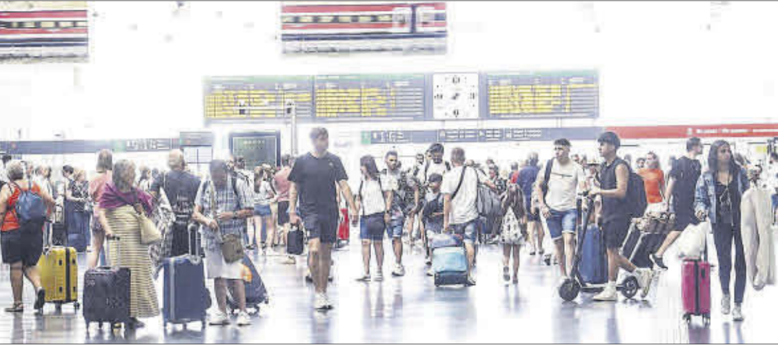
Usuarios de la estación de tren de Alicante este verano.

► La conexión entre la provincia y la capital catalana mueve 235.000 pasajeros en un año, acercándose a las cifras previas a la pandemia, al margen del aumento del tiempo de viaje por los trabajos de infraestructura que se llevan a cabo